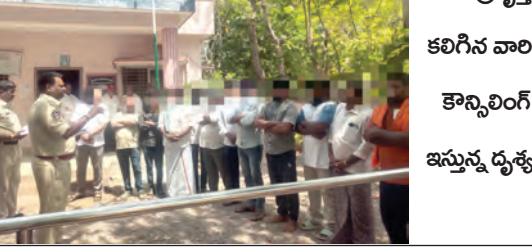
నేర ప్రవృత్తి కలిగిన వారికి కౌన్సిలింగ్ ఇస్తున్న ధృక్వం

అనంతపురం రెవెన్యూ మే 10 ప్రభాతవార్త నేర ప్రవృత్తికి స్పస్తి పలకాలని, పట్ల వ్యతిరేక కార్యకలాపాలకు దూరంగా ఉండాలని పోలీసులు సూచించారు. జిల్లా ఎస్పీ జగదీష్ ఆదేశాలతో ఆదివారం జిల్లాలోని అన్ని పోలీస్ స్టేషన్ పరిధిలోని నేర ప్రవృత్తి కలిగిన వారికి తమవైన శైలిలో కౌన్సిలింగ్ ఇచ్చారు. నేల నియంత్రణ, శాంతి భద్రతల పరిరక్షణలో భాగంగా పోలీసు అధికారులు ఆయా పోలీసు స్టేషన్ల పరిధిలోని రాడ్ షిఫ్టర్లకు, నేరపరిశ్రమ గలవారికి చెడు సడత కలిగిన వ్యక్తులకు కౌన్సిలింగ్ నిర్వహించారు. సత్ప్రవర్తనతో జీవించాలన్నారు. పట్ల వ్యతిరేక కార్యకలాపాలకు దూరంగా ఉండాలన్నారు. తీరు మారకపోతే చట్టపరమైన చర్యలు తప్పవున్నారు. నేర ప్రవృత్తికి స్పస్తి పలికి సత్ప్రవర్తనతో జీవించాలని రాడ్ షిఫ్టర్లకు కౌన్సిలింగ్ చేశారు.