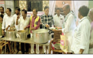
కంటి పరీక్షణ కోసం వచ్చిన వారికి అన్నదానం చేస్తున్న ధృక్వం