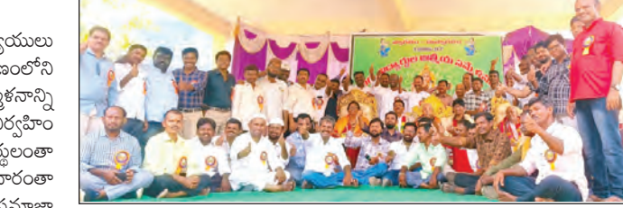
ఉపాధ్యాయులతో పూర్వ విద్యార్థులు