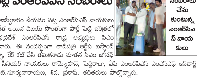
సంబరాలు చేసు కుంటున్న ఎం.ఆర్.పి.ఎస్ నాయకులు