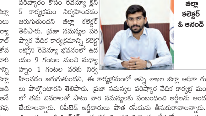
జిల్లా కలెక్టర్ ఓ.ఆనంద్

అనంతపురం కలెక్టరేట్ మే 10 ప్రభాతవార్త మీ కోసం కార్ల సెంటర్ 1100 సేవలను వినియోగించుకోవాలని జిల్లా కలెక్టర్ ఓ.ఆనంద్ ఆదివారం ఒక ప్రకటనలో తెలిపారు. అధికారులు డాఖలు చేసిన తరువాత అర్జీలు ఇప్పటికీ పరిష్కారం కాకపోయినా, లేదా తమ ఫిర్యాదులకు సంబంధించిన సమాచారం తెలుసుకోవడానికి 1100 నంబర్ కు కార్ల చేయవచ్చునన్నారు. అధికారులు వారి యొక్క అర్జీలు నమోదు చేసుకోవడానికి మీకోసం డాట్ ఏపీ డాట్ జిఎఫ్ ఏ డాట్ ఐస్ వెబ్సైట్ నందు వారి యొక్క అర్జీలు నమోదు చేసుకోవచ్చున్నారు. ప్రజలు ఈ అవకాశాన్ని సద్వినియోగం చేసుకోని తమ సమస్యలకు పరిష్కారం పొందాలని జిల్లా కలెక్టర్ విజ్ఞప్తి చేశారు. రెవెన్యూ పరిధిలోని అన్ని ఫిర్యాదుల పరిష్కారం ఆదివారం కార్యాలయాలలో మీకోసం టోకల్ ప్రీ ఛార్జ్ లైన్ నంబర్ 1100 అనే బ్యానర్ ను ఏర్పాటు చేయాలన్నారు. నేడు ఆసా సోమవారం ఆనం తప్ప రం కలెక్టరేట్ లో ప్రజా సమస్యల పరిష్కార వేదిక , రెవెన్యూ సమస్యల