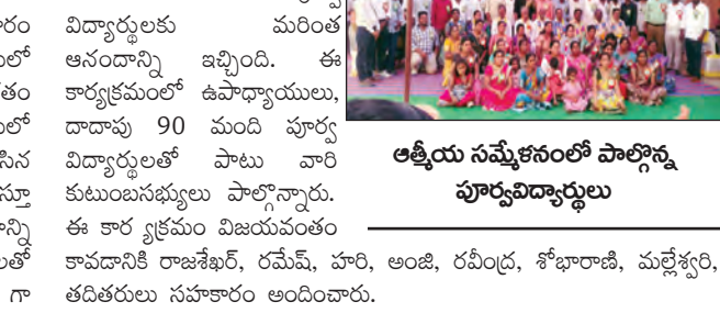
ఆత్మీయ సమ్మేళనంలో పాల్గొన్న పూర్వవిద్యార్థులు

యాడికి, మే 10 ప్రభాతవార్త మండలంలోని రాయలసెరవు జైడీపి హెచ్.ఎస్ స్కూల్ లో 20 సంవత్సరాల క్రితం అనంతపురం జిల్లా విద్యార్థులు ఆదివారం ఆత్మీయ సమ్మేళనం కార్యక్రమాన్ని ఘనంగా జరుపుకున్నారు. ఇందులో భాగంగా తమకు విద్యను బోధించిన ఉపాధ్యాయులకు పుష్పాలతో స్వాగతం పలకడం పట్ల ఉపాధ్యాయులు ఆనందాన్ని వ్యక్తం చేశారు. ఇందులో భాగంగా ఆనాటి జ్ఞాపకాలని ఉపాధ్యాయులతో పంచుకుంటూ వారు చేసిన అభిరుచి గుర్తు చేస్తూ ఉపాధ్యాయులు దండిన వినియోగదారులు గుర్తుచేస్తూ ప్రస్తుతమున్న తమ స్థానాలని తెలియజేస్తూ ఘనంగా కార్యక్రమాన్ని జరుపుకున్నారు. అనంతరం ఉపాధ్యాయులను శాలువలు, పూలమాలలతో సన్మానించి వారి ఆశీర్వాదం తీసుకున్నారు. ఇందులో భాగం గా