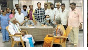
కంటిచూపు మందగించిన వ్యక్తులను పరీక్షిస్తున్న కంటి వైద్యనిపుణులు.